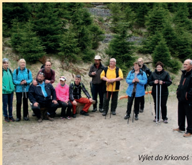
Výlet do Krkonoš

V měsíci květnu jsme se též věnovali přípravě družstev na okrskovou soutěž v požárním útoku, která se uskutečnila v sobotu 3. června na hřišti ve Vlkanči. Naš sbor zastupovala 2 družstva mužů a 1 družstvo žen. Naše soutěžní družstvo mužů A obsadilo třetí místo za družstva Vlkanče a Zbýšova. Naše družstvo žen bylo v soutěži opět bez konkurence a dosáhlo velmi dobrého času 37,3s. Po soutěži se uskutečnilo posezení s občerstvením a s vyhodnocením účasti.