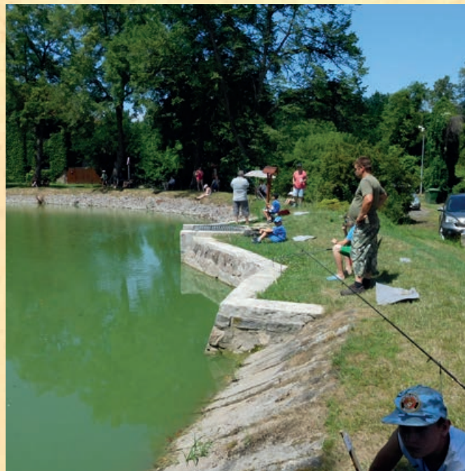
Rybářské závody se letos opravdu vydařily

Třetí ročník rybářských závodů je nyní již minulostí, ale věříme, že všichni zúčastnění na něj mají dobré vzpomínky a do příštího ročníku si společně pořejeme PETRŮV ZDAR!