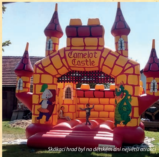
Skákací hrad byl na dětském dni největší atrakcí