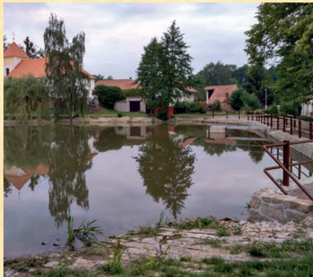
Rybník dal návsi nový pěkný vzhled

Celkové náklady na stavbu činily 1.330.516,- Kč z toho státní dotace byla 1.064.000,- Kč, ze svého rozpočtu obec hradila 266.516,-Kč.