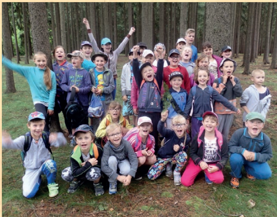
Hurá na prázdniny

Po návratu do školy jsme utvořili 4 družstva pod vedením našich páťáků. Každé si vymyslelo název i sportovní pokřik.