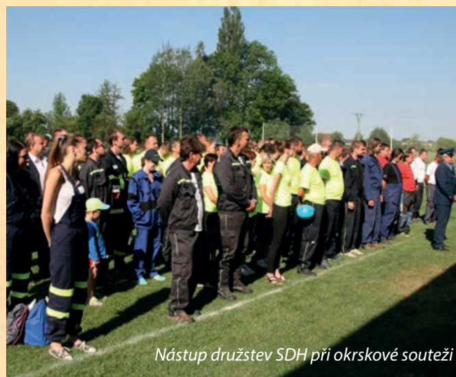
Nástup družstev SDH při okrskové soutěži