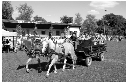
Povoz s koňmi se stal atrakcí nejen pro děti.

koláče a káva. A za mírný poplatek si hosté mohli zakoupit grilované klobásy nebo i pečené sele. Byli zde k vidění draví ptáci a sovy, svůj stánek tu také měli myslivci a zakoupit bylo možné i výrobky z obilí a burčák. Jako zpestření programu byli malé závody, které připravil místní SDH, ale také mláčené cepem snopy obilí. A také na děti nebylo zapomenuto. Byl jim poskytnut nafukovací hrad a jiné soutěže o sladkosti a balonky.