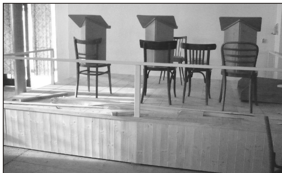
O posvícení budou muzikanti hrát na novém pódii

Úpravy provedli členové sboru dobrovolných hasičů ve svém volném čase. Celkem bylo odpracováno 425 brigádnických hodin. Brigády probíhaly každou středu od 18.00 hodin od začátku měsíce května až do začátku měsíce srpna.