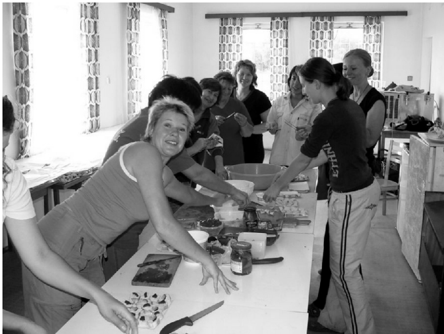
Velký dík za přípravu občerstvení patří místním ženám.

Dva chlapi a dvě dívky byly dokonce převlečeny za obilné panáky tzv. „živé snopy“. Při tomto předávání se také přálo hodně štěstí na další úrodu. Někdy byl věnec i posvěcen a zrníčka z toho věnce byla přimíchána do jarní setby. Po ukončení ceremoniálu hospodář obdaroval chasu penězi a hospodářka napekla tzv. „mílové buchty“ (1 pekáč = 2 buchty) a celá slavnost byla zakončena v hospodě, kde bylo vše řádně zapito a peníze od hospodáře utráceny při taneční zábavě. První tanec patřil hospodářům a hospodářce, kteří otevřeli kolo pro ostatní. Další den se všechno obilí vymlátilo cepy a poslední obilí bylo