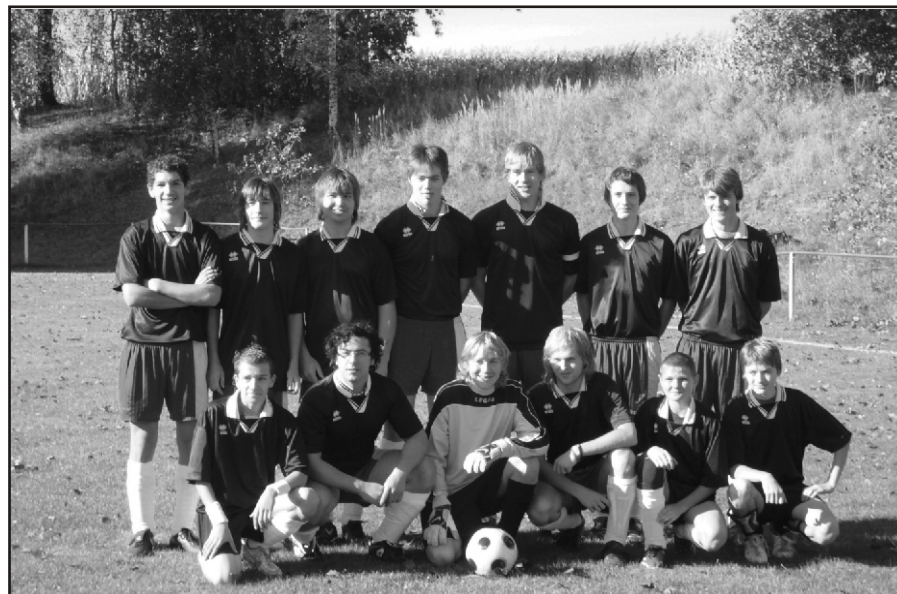
Fotbalový tým dorostu Vlkaneč.