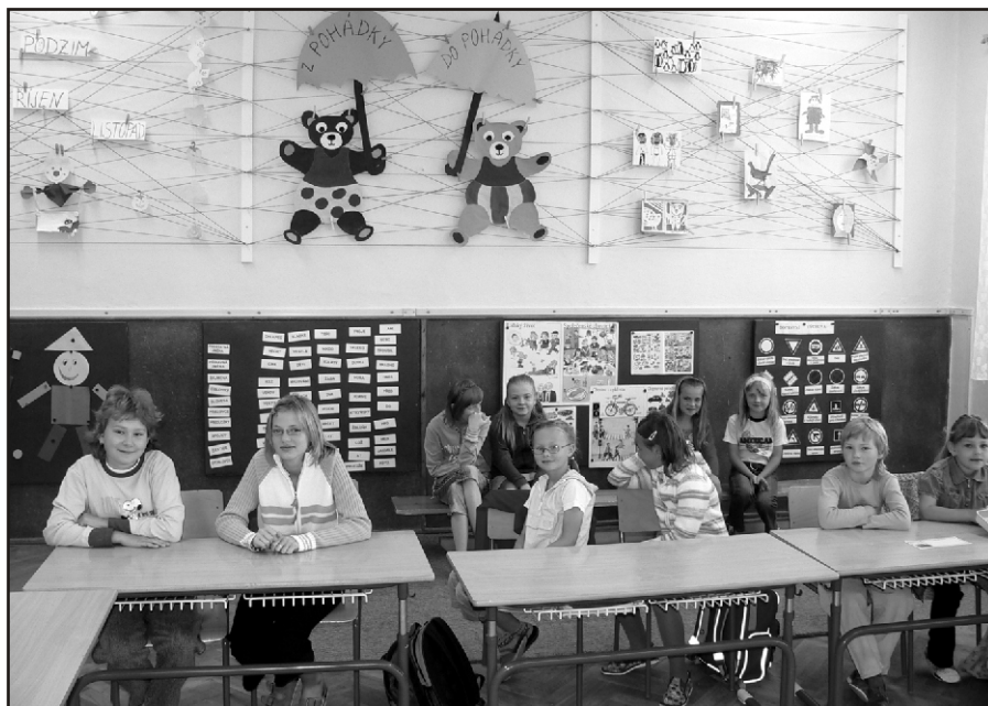
1. září byla škola jako ze škatulky