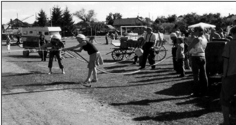
Zahrát si na hasiče, byla fajn zábava.