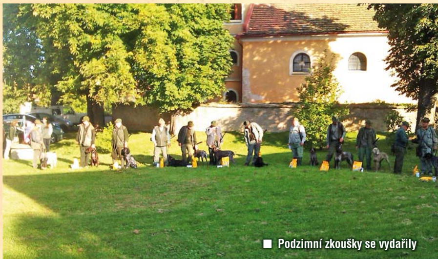
■ Podzimní zkoušky se vydařily

V měsíci listopadu začnou hony na drobnou a škodnou zvěř a potrvají až do konce roku. Celkem budou čtyři, během kterých bude probíhat i lov černé zvěře, která se