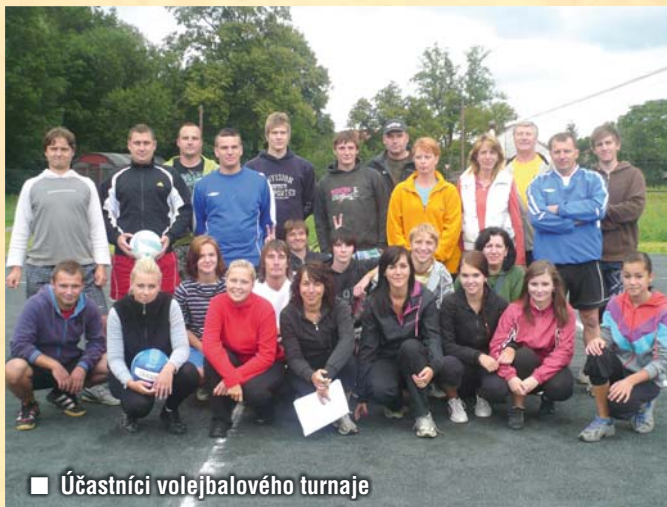
■ Účastníci volejbalového turnaje

28.9.2012 pro velký zájem byl sehrán ještě jeden turnaj na ukončení volejbalové sezony v tomto roce. Přijeli nás podpořit i zájemci o tento sport z Golčova Jeníkova. Tentokrát mezi sebou soupeřily tři týmy. Již nyní se těšíme na další derby v příštím roce.