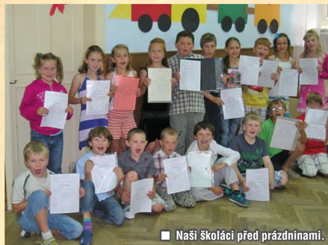
■ Naši školáci před prázdninami.