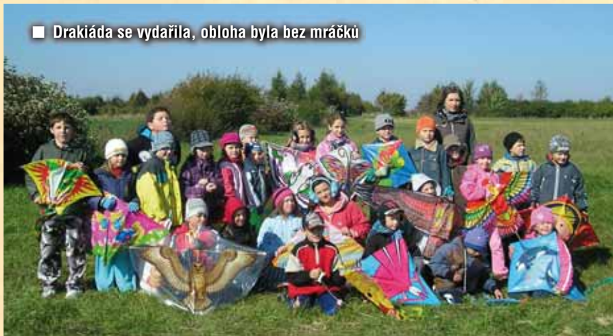
■ Drakiáda se vydařila, obloha byla bez mráčků