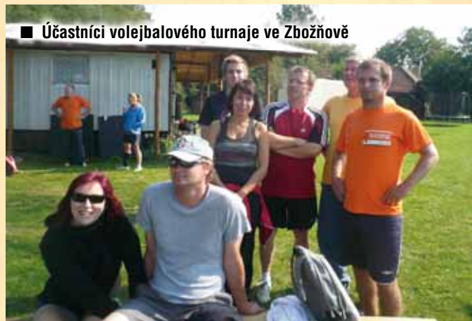
■ Účastníci volejbalového turnaje ve Zbožňově