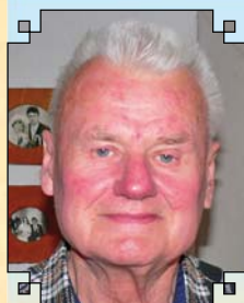
Janáček Zdeněk 80 let