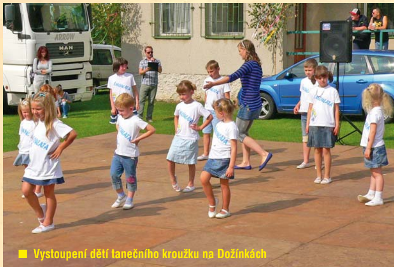
Vystoupení dětí tanečního kroužku na Dožínkách