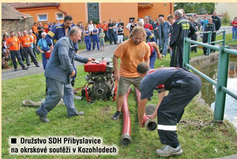
■ Družstvo SDH Přibyslavice na okrskové soutěži v Kozohlodech