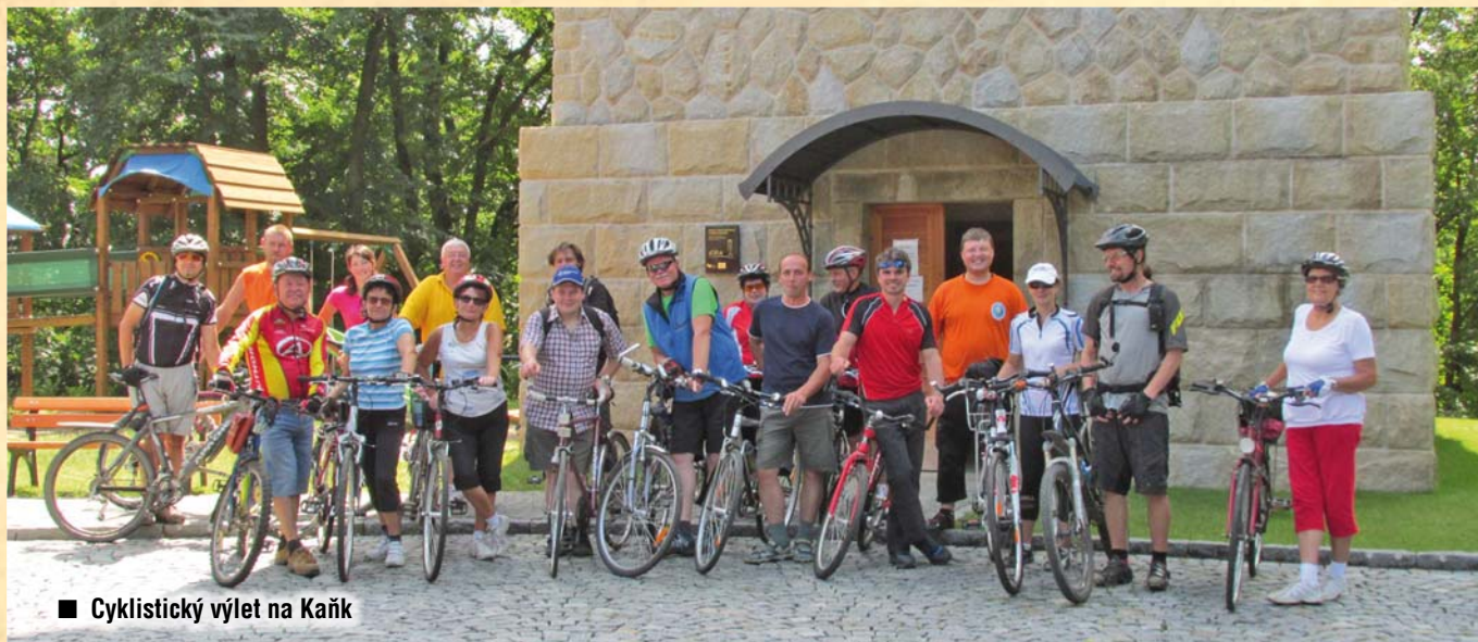
■ Cyklistický výlet na Kaňk