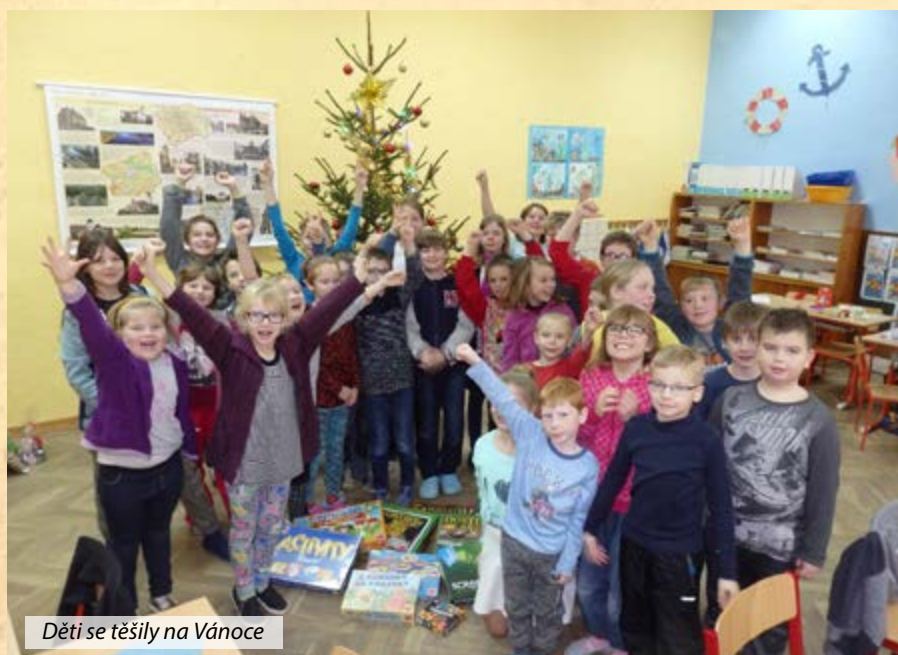
Děti se těšily na Vánoce

Do nového roku 2018 bych chtěla popřát nám všem hodně štěstí, zdraví, úspěchů a vzájemného porozumění. Ať nás celým rokem provází radost a smích našich dětí.