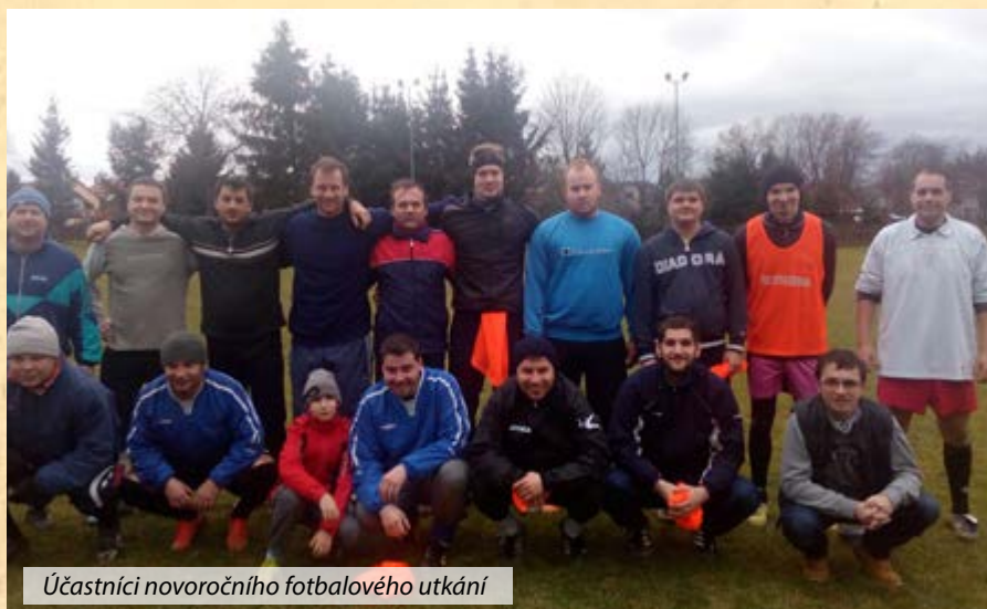
Účastníci novoročního fotbalového utkání