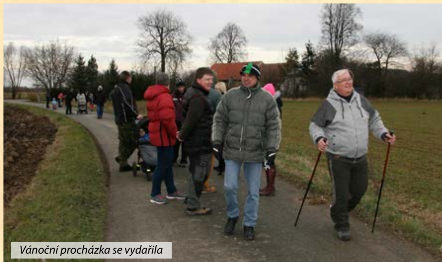
Vánoční procházka se vydařila

V sobotu 2. prosince 2017 členové našeho sboru opět postavili vánoční strom a zajisti-