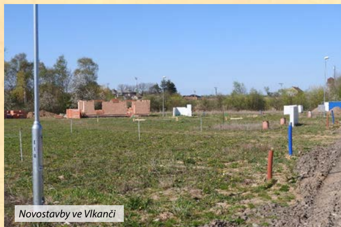
Novostavby ve Vlkaneči

Situace v obecních lesích není dobrá. Je stejná jako v celé republice, díky teplé a suché zimě a teplému nástupu jara se nepodařilo omezit působení kůrovce. Těží se napadené dřevo ve smrkových kulturách, ale kůrovec začal škodit i v borovicích. A protože je nadbytek dřeva na trhu, neustále klesají výkupní ceny dřeva. V současnosti poklesl i odbyt do Číny. Chtěl bych poděkovat členům SDH Kozohlody, SDH Vlkaneč, MS Diana a TJ Sokol Vlkaneč, kteří se zúčastnili prací při úklidu lesa, opravě a budování oplocenek. Snažíme se zalesňovat, bylo postaveno 350 m nových oplocenek a zasázeno 5 500 stromků. Bude pokračovat těžba poškozených stromů. Ve spolupráci s odborným lesním hospodářem jsme zažádali o dotaci na kompenzaci cen dřeva poškozeného kůrovcem za roky 2017–2018.