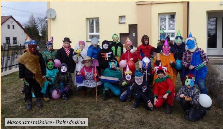
Masopustní taškařice - školní družina