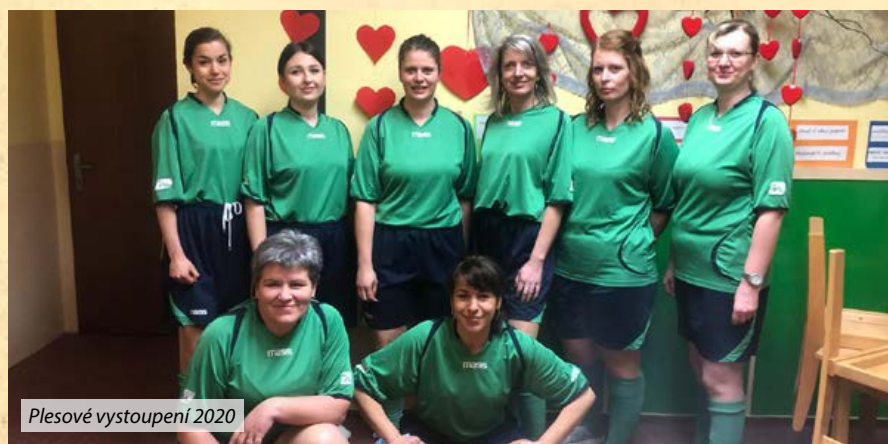
Plesové vystoupení 2020

Vážení čtenáři, když jsem byla požádána o příspěvek do Zpravodaje, byla jsem zaskočena a říkala jsem si, zda je to myšleno vážně, o čem mám vlastně psát. Byla jsem po-