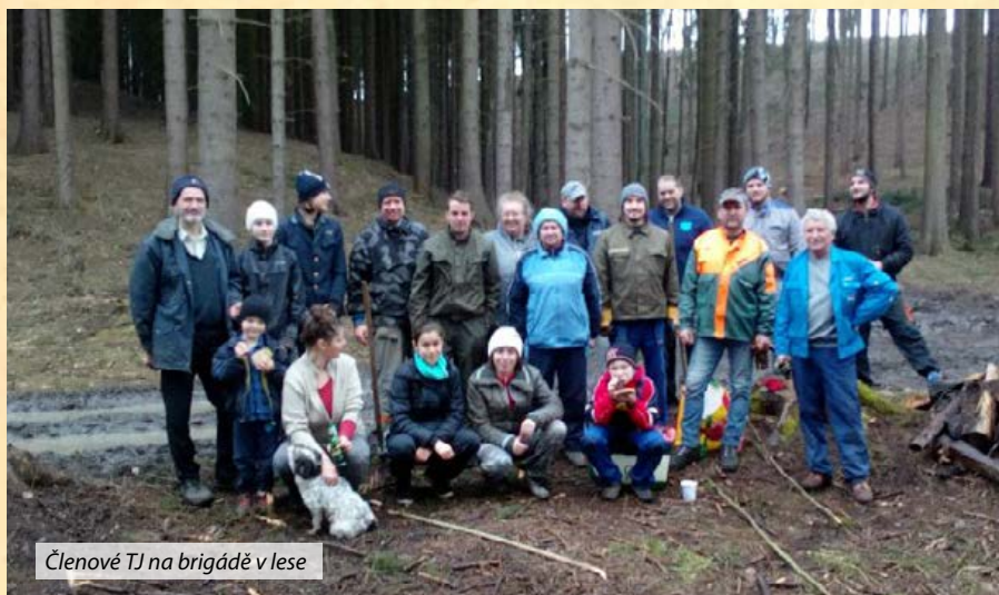
Členové TJ na brigádě v lese

V sobotu 29. února jsme již po třetí uspořádali ples. Stejně jako loni tak i tento rok musím tuto akci vydvih-