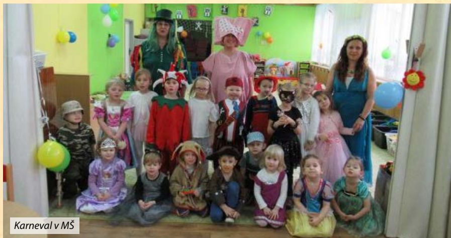
Karneval v MŠ

V lednu i únoru nadále probíhaly Dny otevřených dveří pro děti mladší 3 let