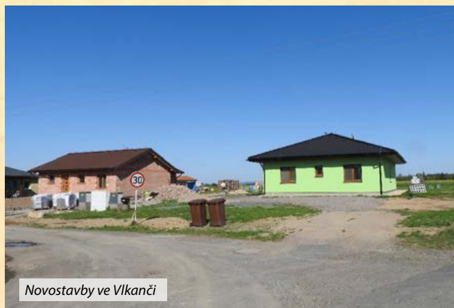
Novostavby ve Vlkaneči