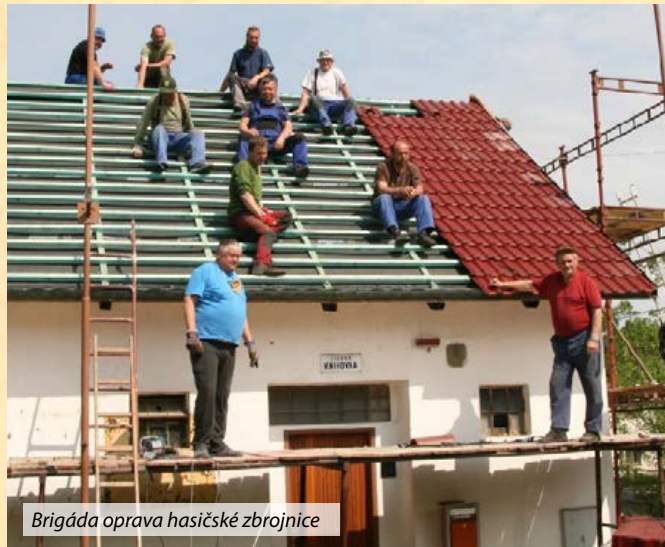
Brigáda oprava hasičské zbrojnice